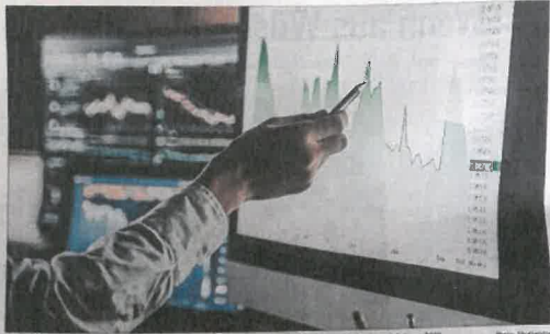
Les principaux indices de la Place financière luxembourgeoise ont enregistré une hausse de leurs activités en 2019.